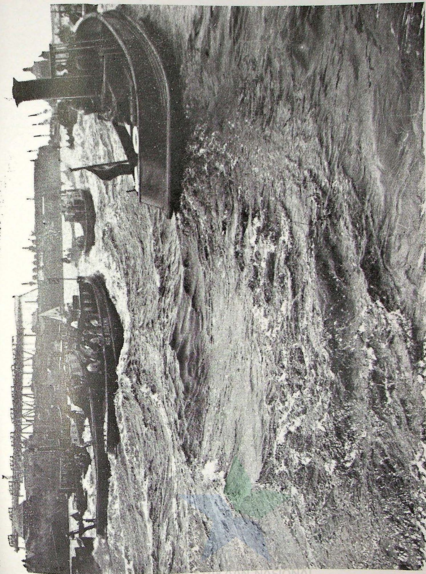
Ieder jaar voeren de 'alrijke kleine sleepbootjes en motorbarkassen uit de haven van Hamburg een vervoeden strijd op de Elbe. Wie wint, mag dat jaar „het blauwe lint van de Elbe" voeren, hetgeen een grocie onderscheiding is. — De start van de motor barkassen. Hoog golft het water achter de weg-schietende booten op.