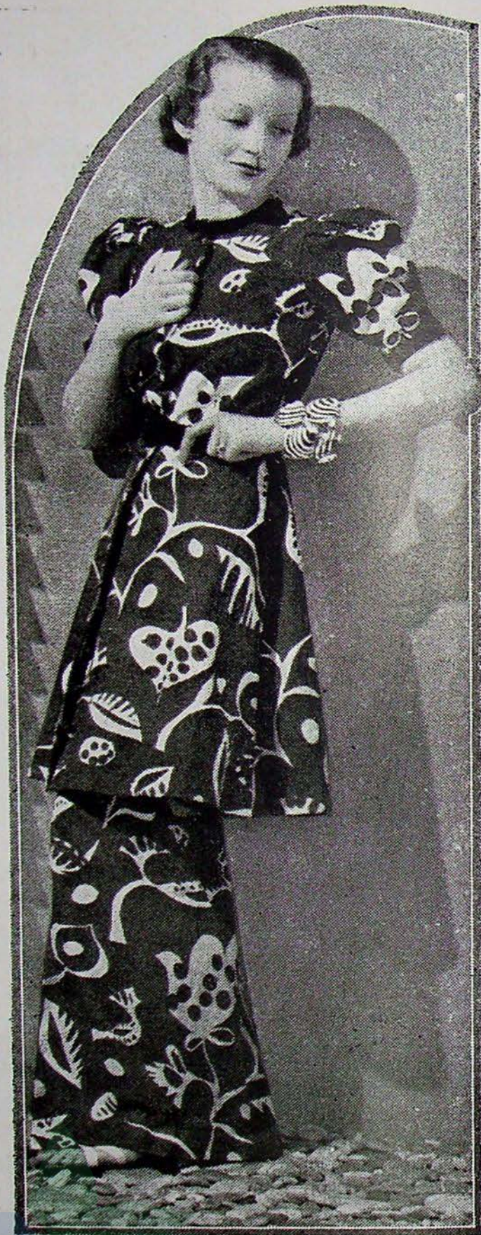
Bij het strand hooren schelpen. — Voor een bezoek aan het Casino: een costuumpje van zijden toile. (witte bloemen op een rood fond) afgezet met effen rood velours. Een nieuw snuffje, dat vooral in badplaatsen opgeld zal doen, is de armband, welke uit schelpen van helderblauw glas bestaat.

Hoewel de rijkste, is de hertog geenszins de eenige grootgrondbezitter van Londen. Tien jaar geleden was de stad verdeeld over zoowat een dozijn grondelgenaren.